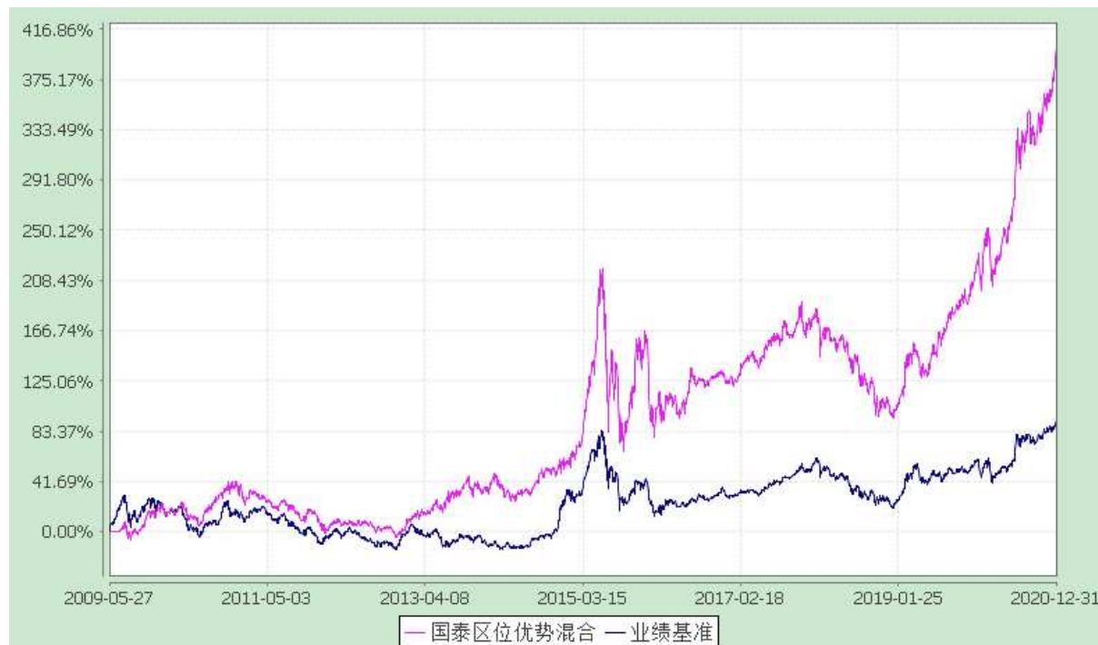
自基金合同生效以来份额累计净值增长率与业绩比较基准收益率的历史走势对比图 (2009 年 5 月 27 日至 2020 年 12 月 31 日)

注：本基金合同生效日为 2009 年 5 月 27 日。本基金在六个月建仓期结束时，各项资产配置比例符合合同约定。