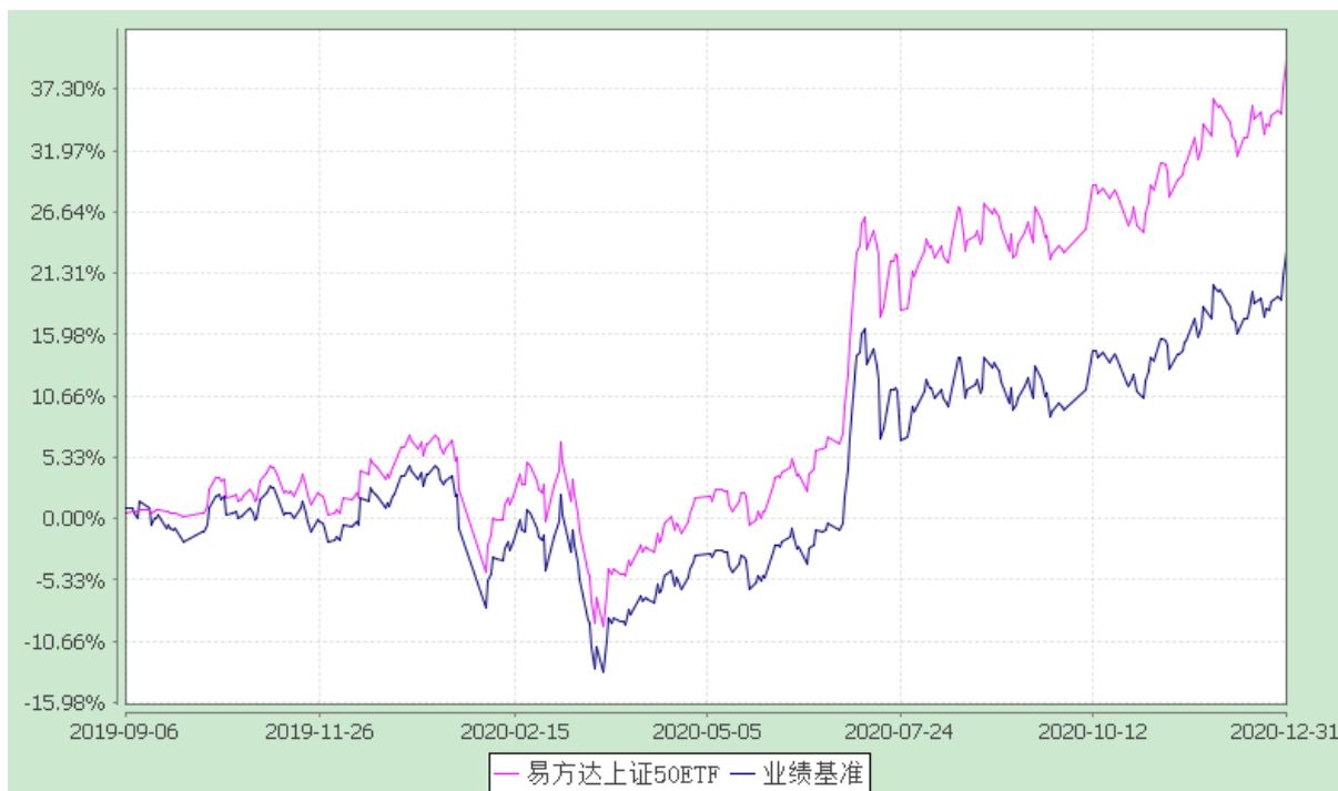
易方达上证 50 交易型开放式指数证券投资基金 份额累计净值增长率与业绩比较基准收益率历史走势对比图 (2019 年 9 月 6 日至 2020 年 12 月 31 日)

注：1.按基金合同和招募说明书的约定，本基金的建仓期为六个月，建仓期结束时各项资产配置比例符合基金合同(第十四部分二、投资范围，三、投资策略和四、投资限制)的有关约定。