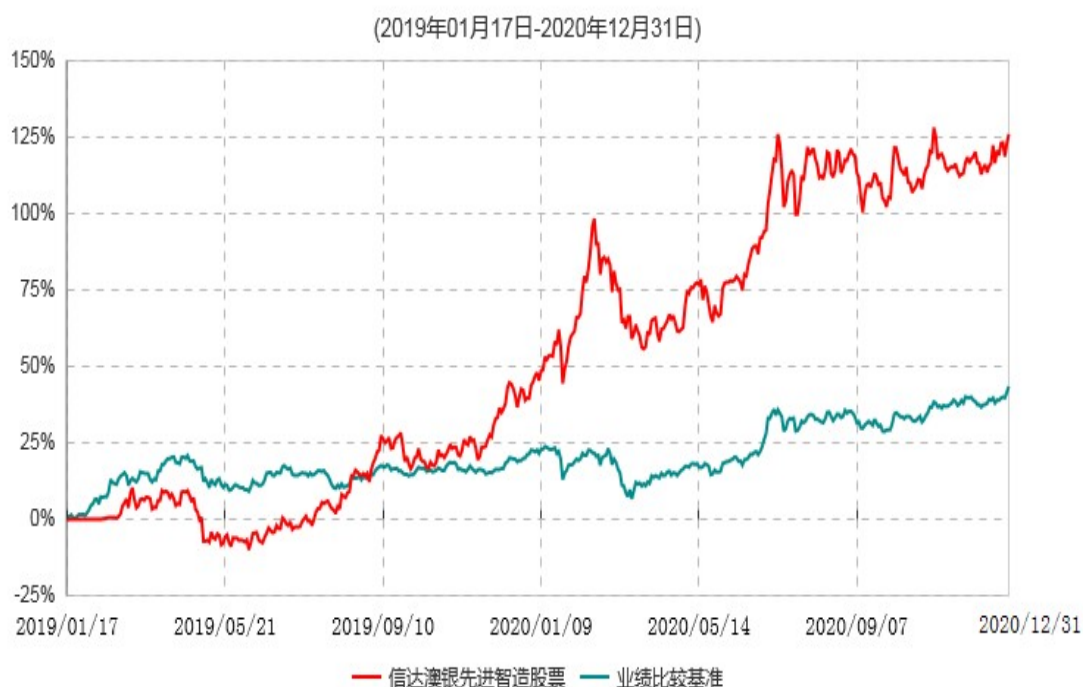
信达澳银先进智造股票型证券投资基金累计净值增长率与业绩比较基准收益率历史走势对比图

注：1、本基金基金合同于2019年1月17日生效，2019年2月18日开始办理申购、赎回、定期定额投资业务。