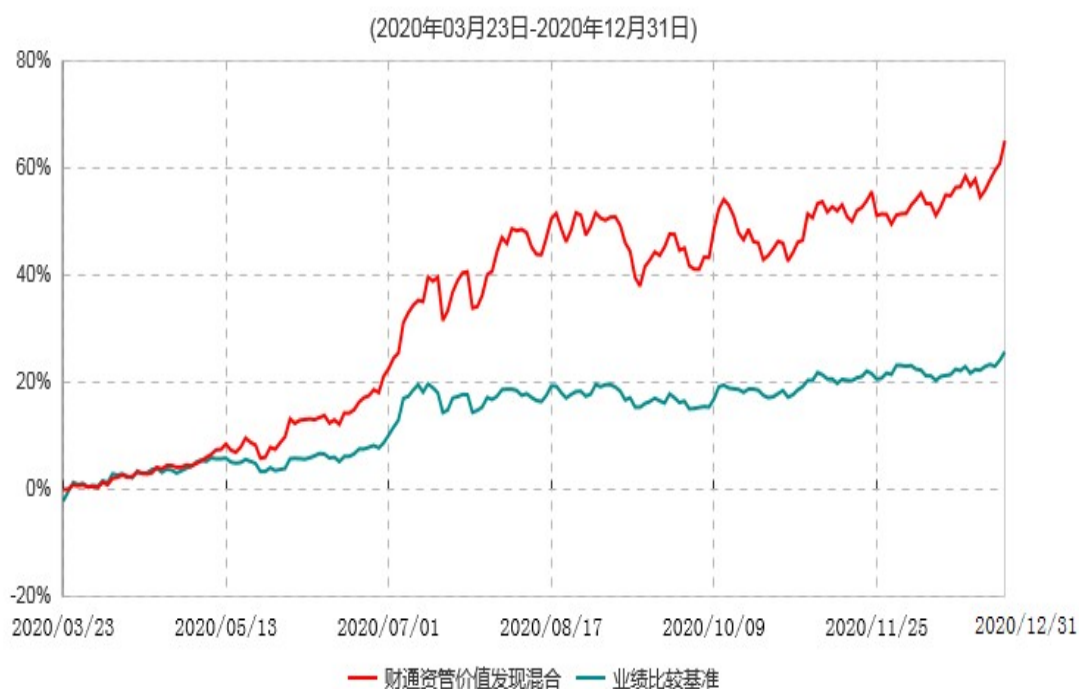
财通资管价值发现混合型证券投资基金累计净值增长率与业绩比较基准收益率历史走势对比图