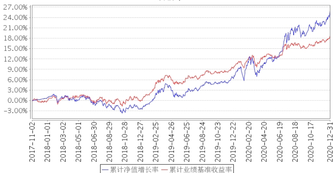
建信福泽安泰混合（FOF）累计净值增长率与同期业绩比较基准收益率的历史走势对比图