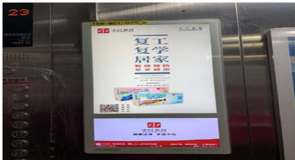
注：图为中红普林集团医疗手套产品广告投放实拍

广告推广方面，公司积极尝试广告投放，在京津冀地区初步建立了品牌知名度。公司 2020 年 3 月与“新潮传媒”合作，在北京和唐山发布了 5 秒、10 秒、15 秒版本广告，两地共投放梯内、梯外 2,000 块屏幕，发布周期约 3 个月。