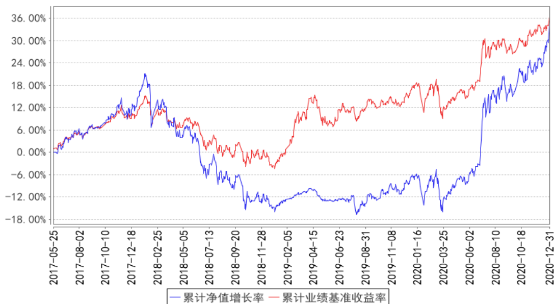
华宝第三产业混合累计净值增长率与同期业绩比较基准收益率的历史走势对比图

注: 按照基金合同的约定, 自基金成立日期的 6 个月内达到规定的资产组合, 截至 2017 年 11 月 25 日, 本基金已达到合同规定的资产配置比例。