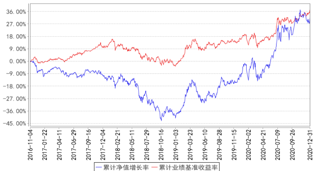
华宝未来主导混合累计净值增长率与同期业绩比较基准收益率的历史走势对比图

注：按照基金合同的约定，基金管理人应当自基金合同生效之日起六个月内使基金的投资组合比例符合基金合同的有关约定。截至 2017 年 5 月 4 日，本基金已达到合同规定的资产配置比例。