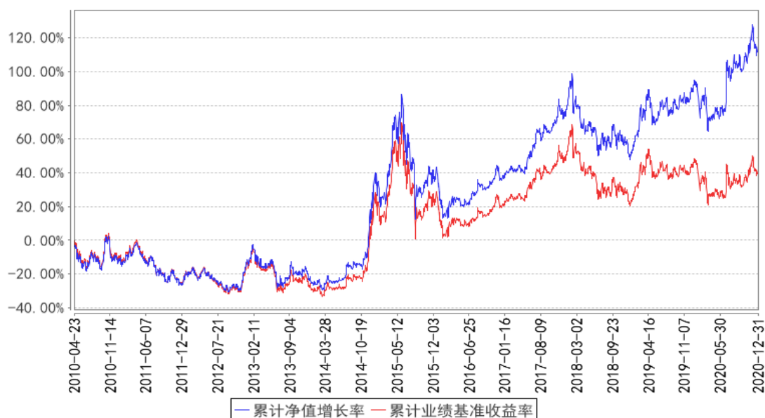
上证180价值ETF累计净值增长率与同期业绩比较基准收益率的历史走势对比图

注：基金依法应自成立日期起 6 个月内达到基金合同约定的资产组合，截至 2010 年底，本基金已达到合同规定的资产配置比例。