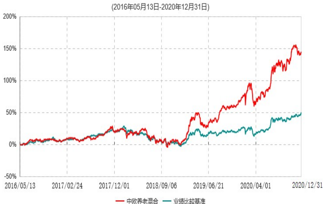
中欧养老产业混合型证券投资基金累计净值增长率与业绩比较基准收益率历史走势对比图