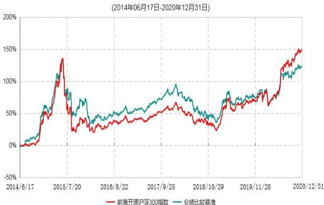
前海开源沪深300指数型证券投资基金累计净值增长率与业绩比较基准收益率历史走势对比图