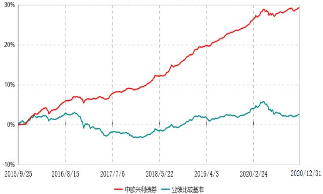
中欧兴利债券型证券投资基金累计净值增长率与业绩比较基准收益率历史走势对比图 (2015年09月25日-2020年12月31日)