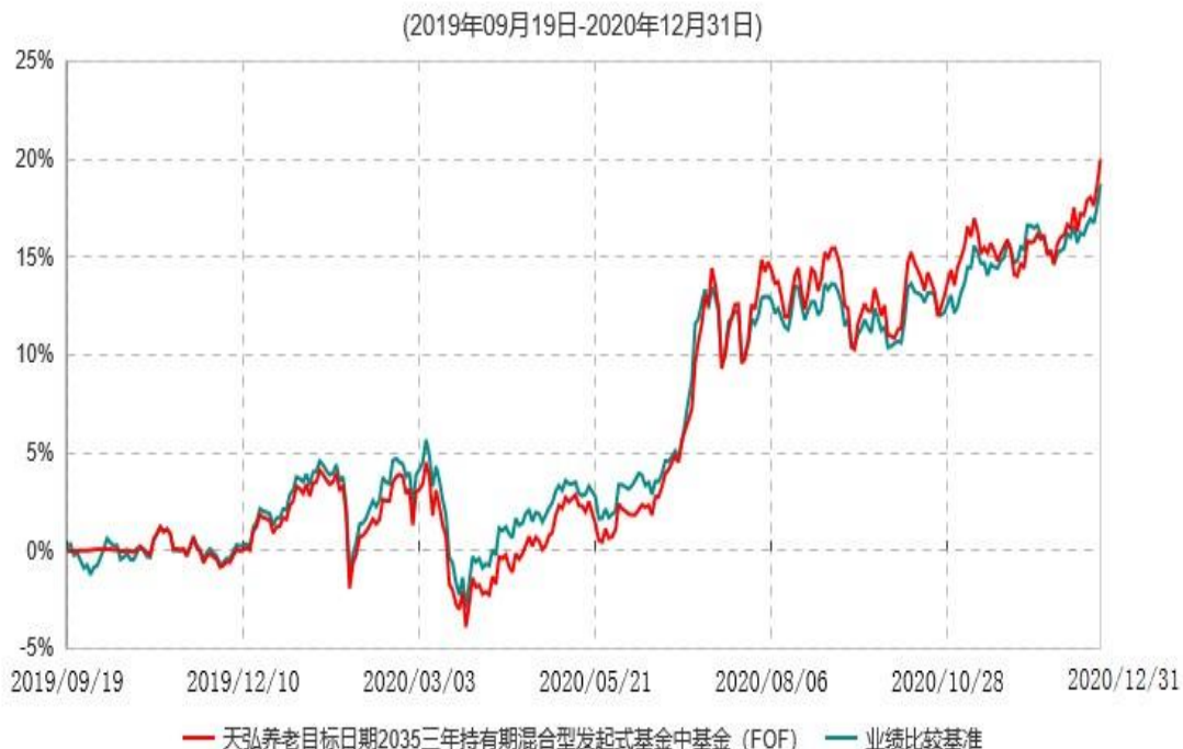
天弘养老目标日期2035三年持有期混合型发起式基金中基金（FOF）累计净值增长率与业绩比较基准收益率历史走势对比图