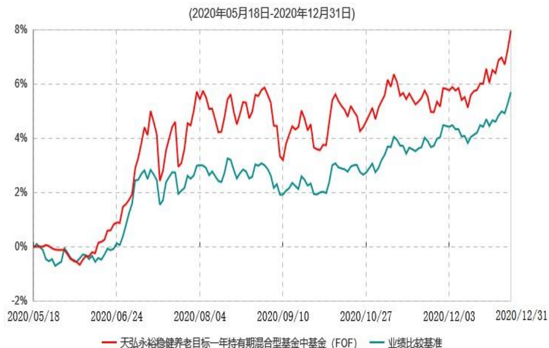
天弘永裕稳健养老目标一年持有期混合型基金中基金（FOF）累计净值增长率与业绩比较基准收益率历史走势对比图

注：1、本基金合同于2020年05月18日生效，本基金合同生效起至披露时点不满1年。