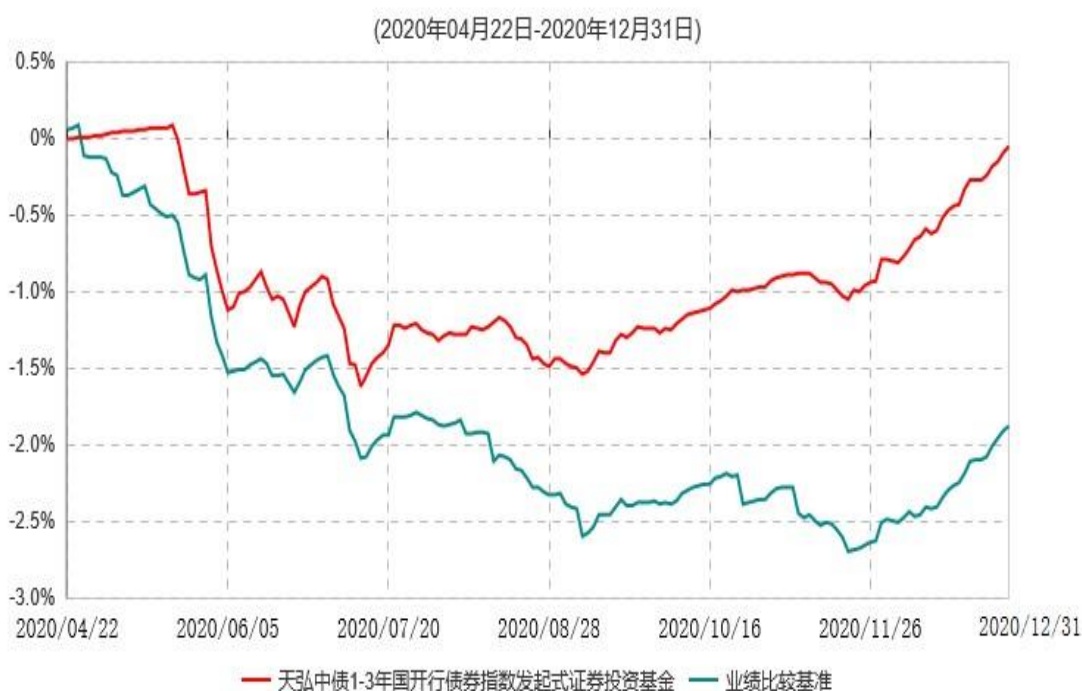
天弘中债1-3年国开行债券指数发起式证券投资基金累计净值增长率与业绩比较基准收益率历史走势对比图

注：1、本基金合同于2020年04月22日生效，本基金合同生效起至披露时点不满1年。