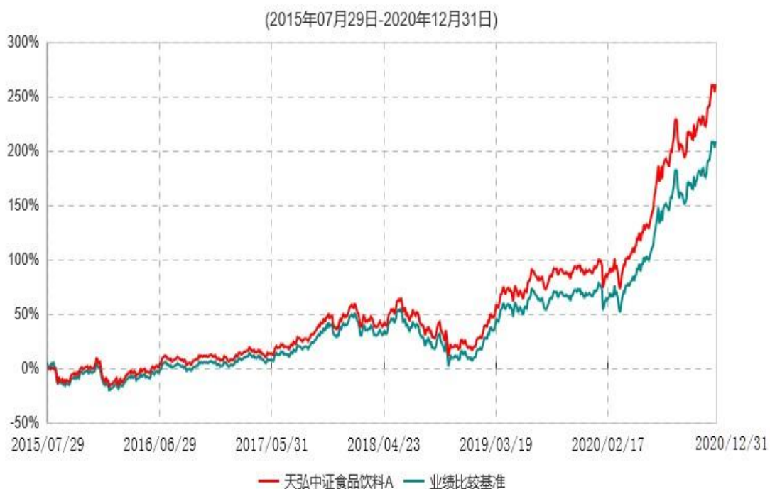
天弘中证食品饮料A累计净值增长率与业绩比较基准收益率历史走势对比图