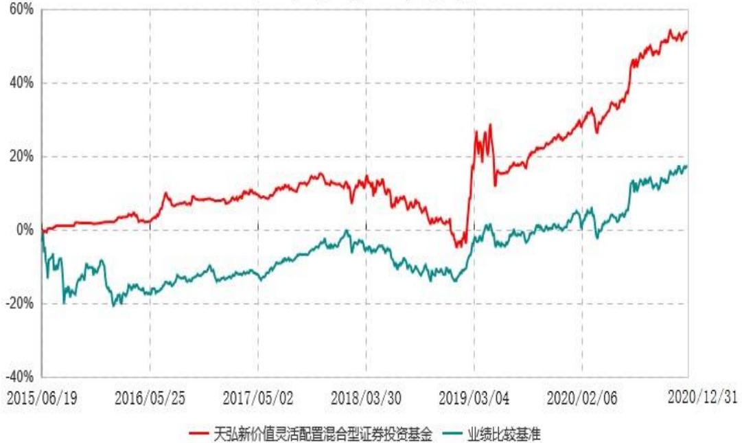
天弘新价值灵活配置混合型证券投资基金累计净值增长率与业绩比较基准收益率历史走势对比图 (2015年06月19日-2020年12月31日)