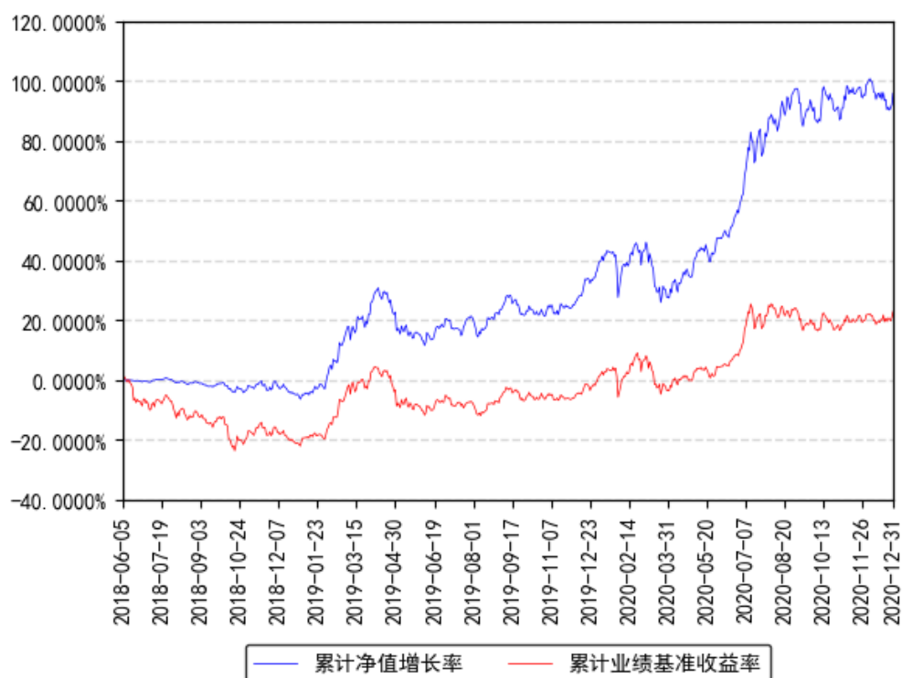
南方潜力新蓝筹混合累计净值增长率与同期业绩比较基准收益率的历史走势对比图

本基金转型日期为 2018 年 6 月 5 日，由原南方丰合保本混合型证券投资基金转型为南方潜力新蓝筹混合型证券投资基金。