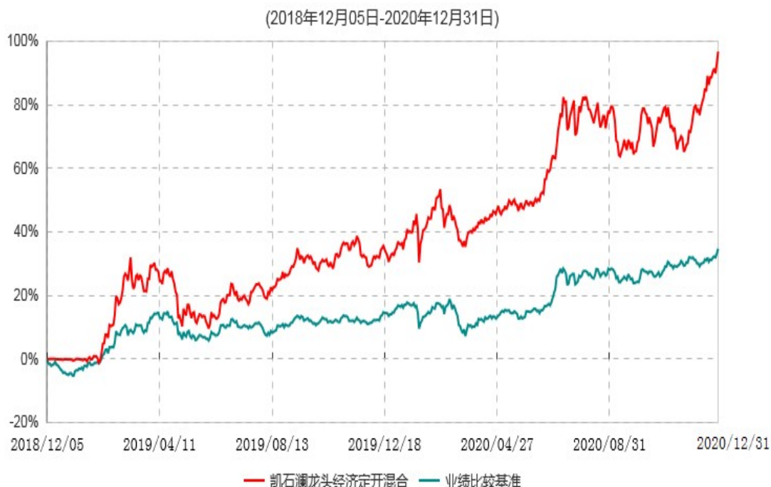
凯石澜龙头经济定期开放混合型证券投资基金累计净值增长率与业绩比较基准收益率历史走势对比图