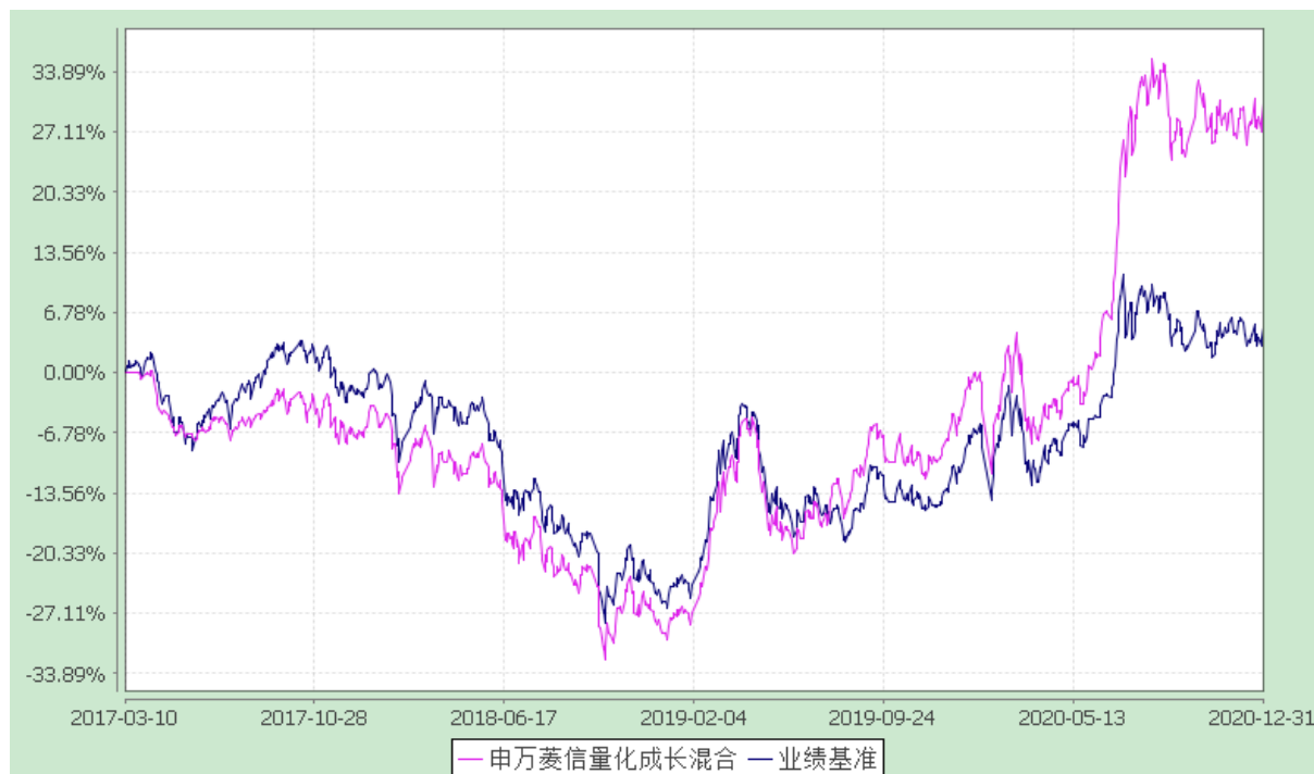
自基金合同生效以来份额累计净值增长率与业绩比较基准收益率的历史走势对比图 (2017 年 3 月 10 日至 2020 年 12 月 31 日)