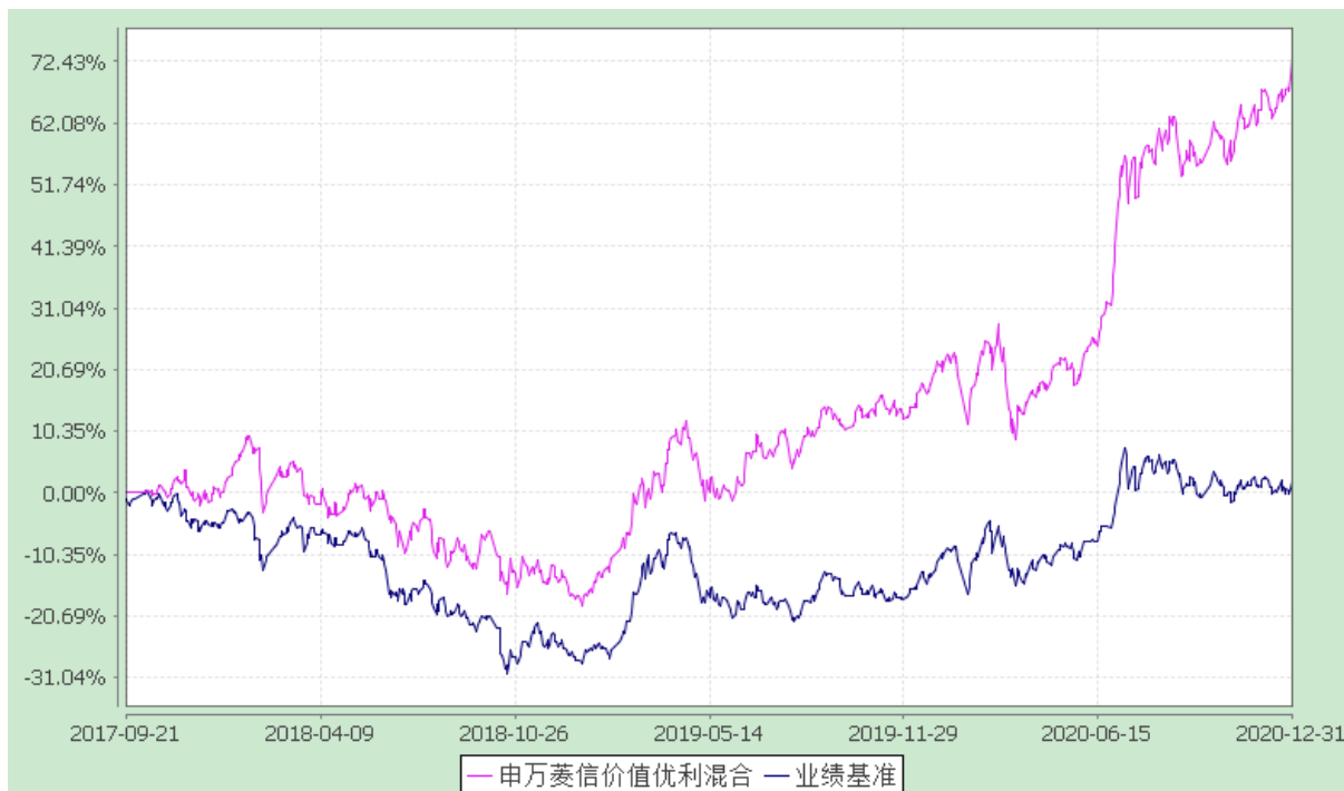
自基金合同生效以来份额累计净值增长率与业绩比较基准收益率的历史走势对比图 (2017 年 9 月 21 日至 2020 年 12 月 31 日)