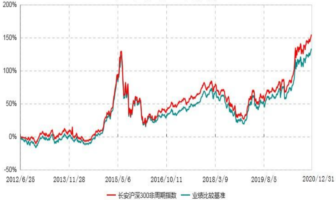
长安沪深300非周期行业指数证券投资基金累计净值增长率与业绩比较基准收益率历史走势对比图 (2012年06月25日-2020年12月31日)

根据基金合同的规定,自基金合同生效之日起6个月内基金各项资产配置比例需符合基金合同要求。本基金在建仓期结束后,各项资产配置比例已符合基金合同有关投资比例的约定。基金合同生效日至报告期期末,本基金运作时间超过一年,图示日期为2012年06月25日至2020年12月31日。