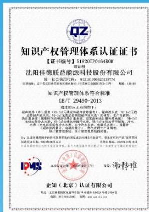
2020年6月公司取得知识产权管理体系认证证书