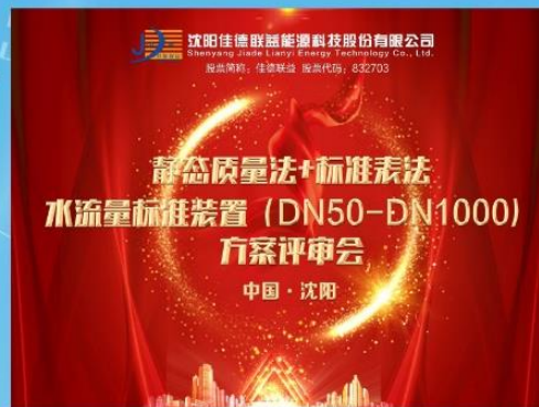
2020年10月国家级流量专家对佳德联益静态质量法+标准表法水流量标准装置(DN50-DN1000)方案进行评审