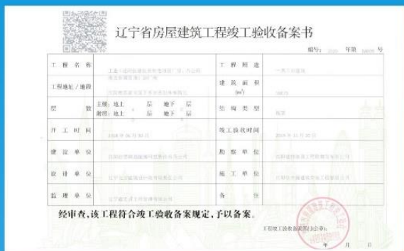
佳德联益智能科技产业园取得房屋建筑工程竣工验收备案书