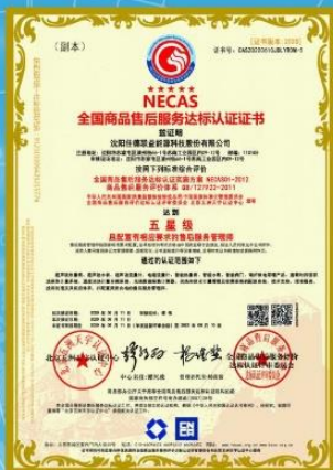
2020年6月公司取得全国商品售后服务达标认证证书