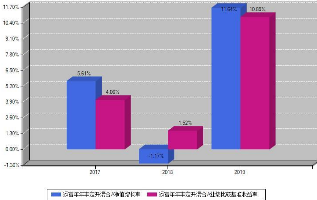
添富年年丰定开混合A每年净值增长率与同期业绩基准收益率对比图

注：基金的过往业绩不代表未来表现。本《基金合同》生效之日为2017年04月20日，合同生效当年按实际存续期计算，不按整个自然年度进行折算。