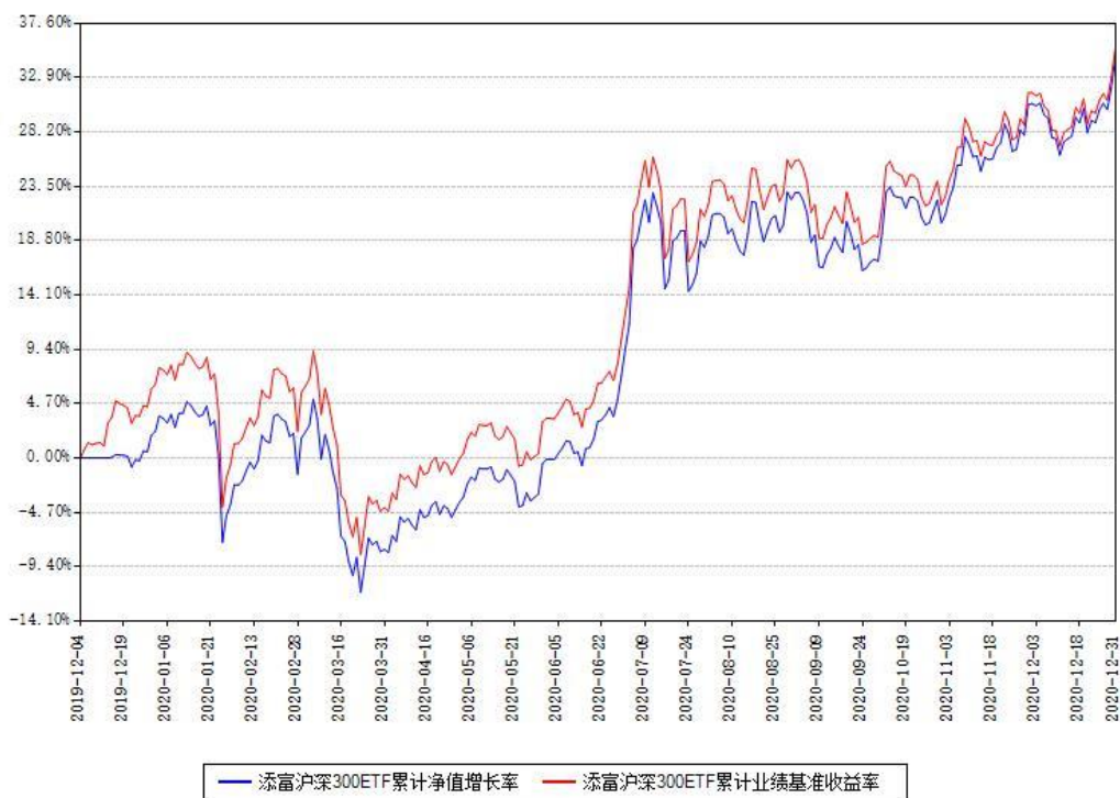
添富沪深300ETF累计净值增长率与同期业绩基准收益率对比图

(二) 自基金合同生效以来基金累计净值增长率变动及其与同期业绩比较基准收益率变动的比较图