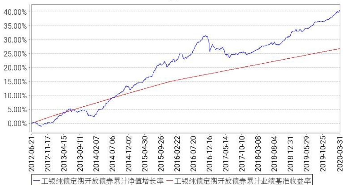
工银纯债定期开放债券累计净值增长率与同期业绩比较基准收益率的历史走势对比图