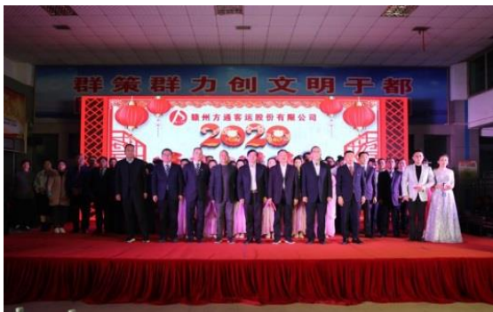
1. “庆元旦、迎新春”晚会