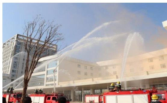
4. 119 消防宣传月灭火救援实战演练