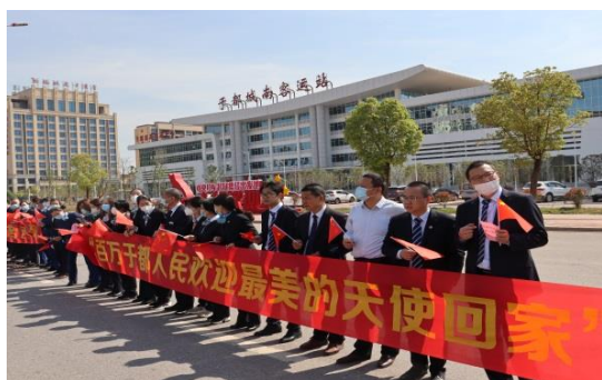
3. 迎接于都籍抗疫英雄凯旋