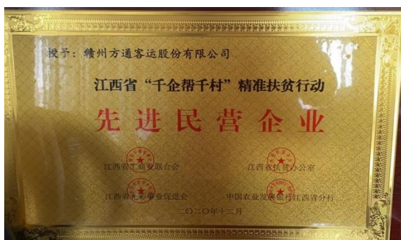
6. 公司获“先进民营企业”荣誉称号