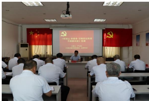
2. 党员及骨干“三会一课”