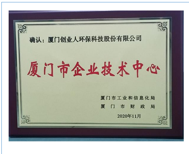
2020 年 11 月，公司获评“厦门市企业技术中心”称号。