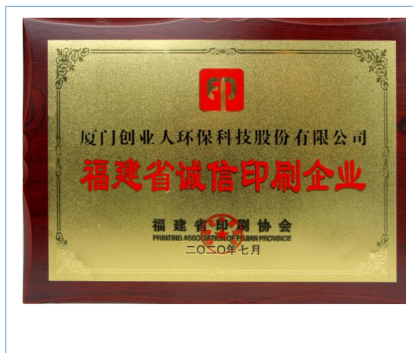
2020 年 7 月，公司获评“福建省诚信印刷企业”。