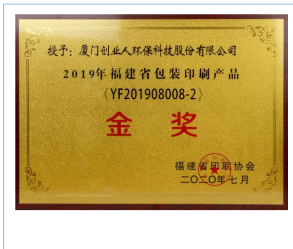
2020 年 7 月，公司产品获得福建省包装印刷产品金奖。