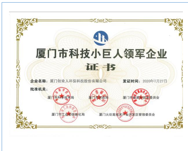
2020 年 7 月，公司获评“厦门市科技小巨人领军企业证书”称号。