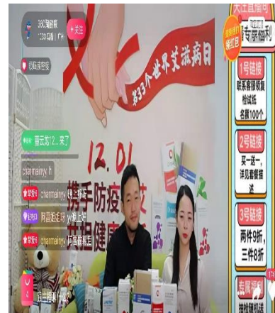
公司与康爱多大药房2020年世界艾滋病日直播活动 ®