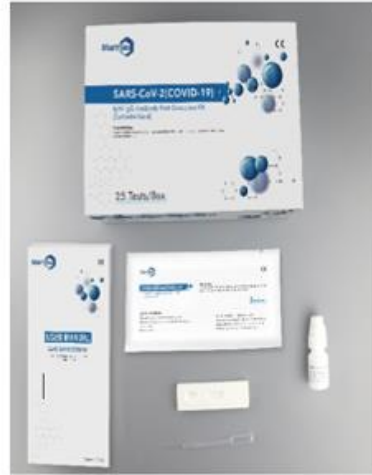
2020年5月公司的新冠肺炎抗体检测产品进入出口白名单，并完成出口备案 ®