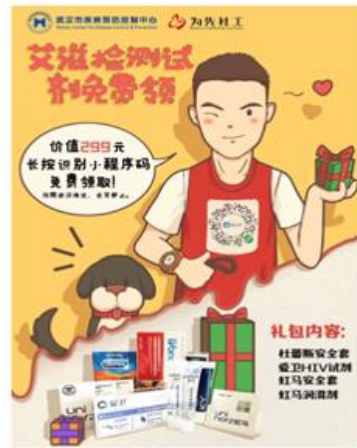
公司与武汉市CDC合作开展艾滋检测公益活动 ®