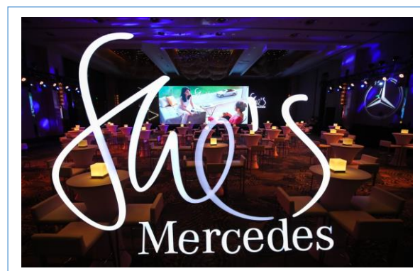
奔驰北区 SHE`S 体验日