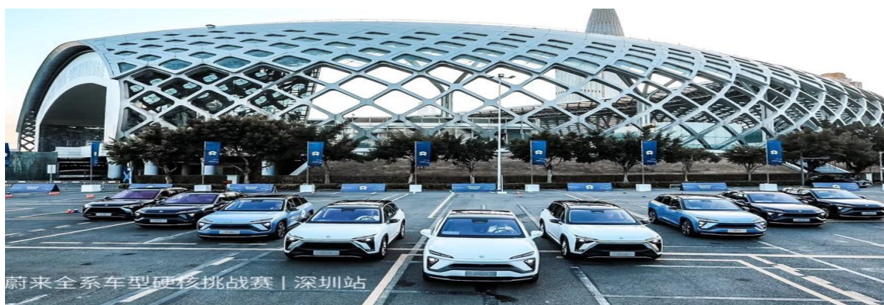
2020 蔚来全系硬核挑战赛