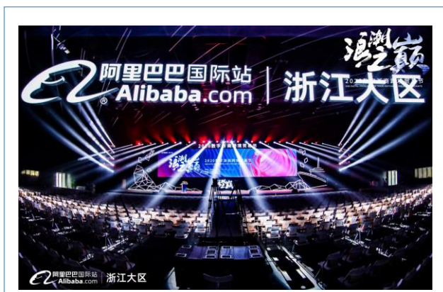
阿里巴巴国际站-浙江区