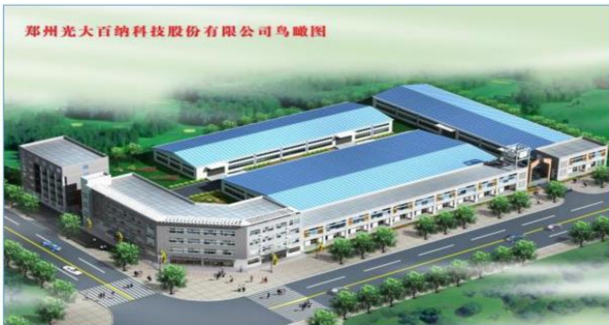
郑州光大百纳科技股份有限公司鸟瞰图

Zhengzhou Guangda Baina Technology Co.,Ltd.