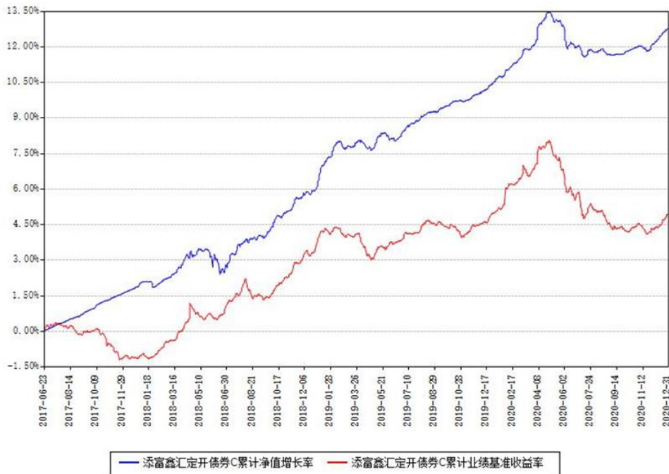
添富鑫汇定开债券C累计净值增长率与同期业绩基准收益率对比图