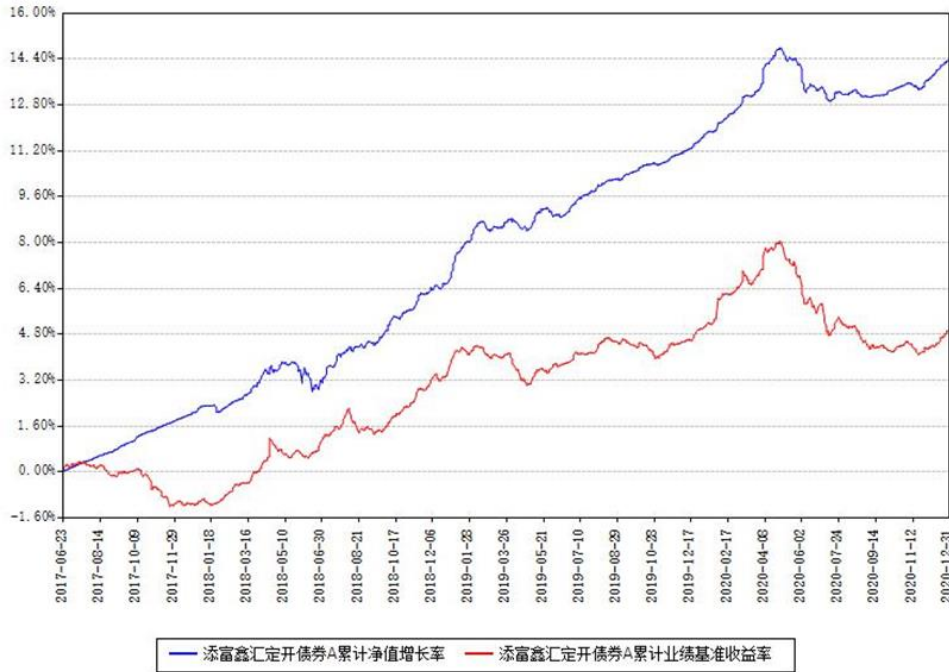
添富鑫汇定开债券A累计净值增长率与同期业绩基准收益率对比图