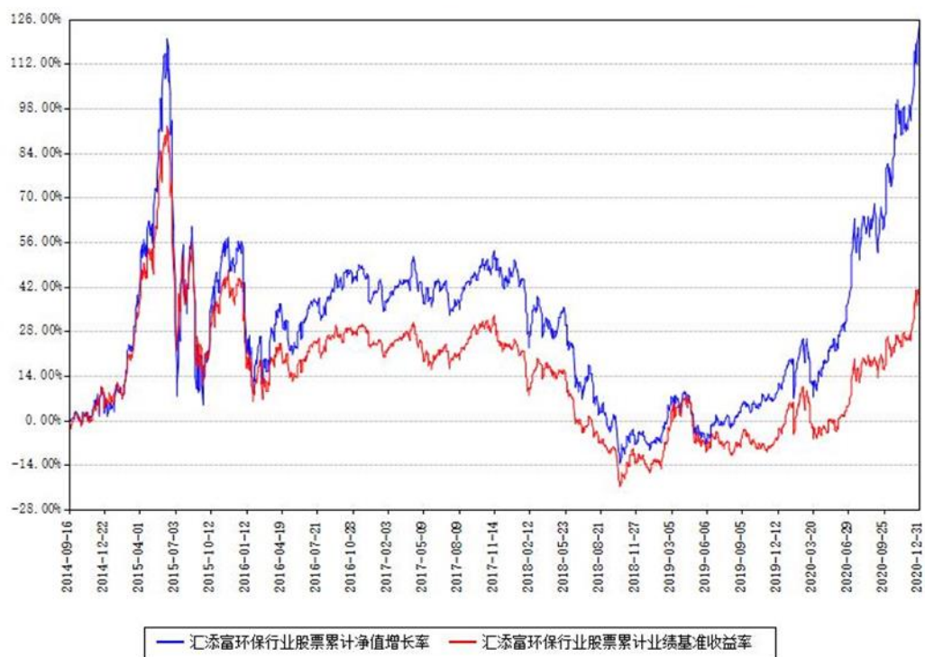
汇添富环保行业股票累计净值增长率与同期业绩基准收益率对比图