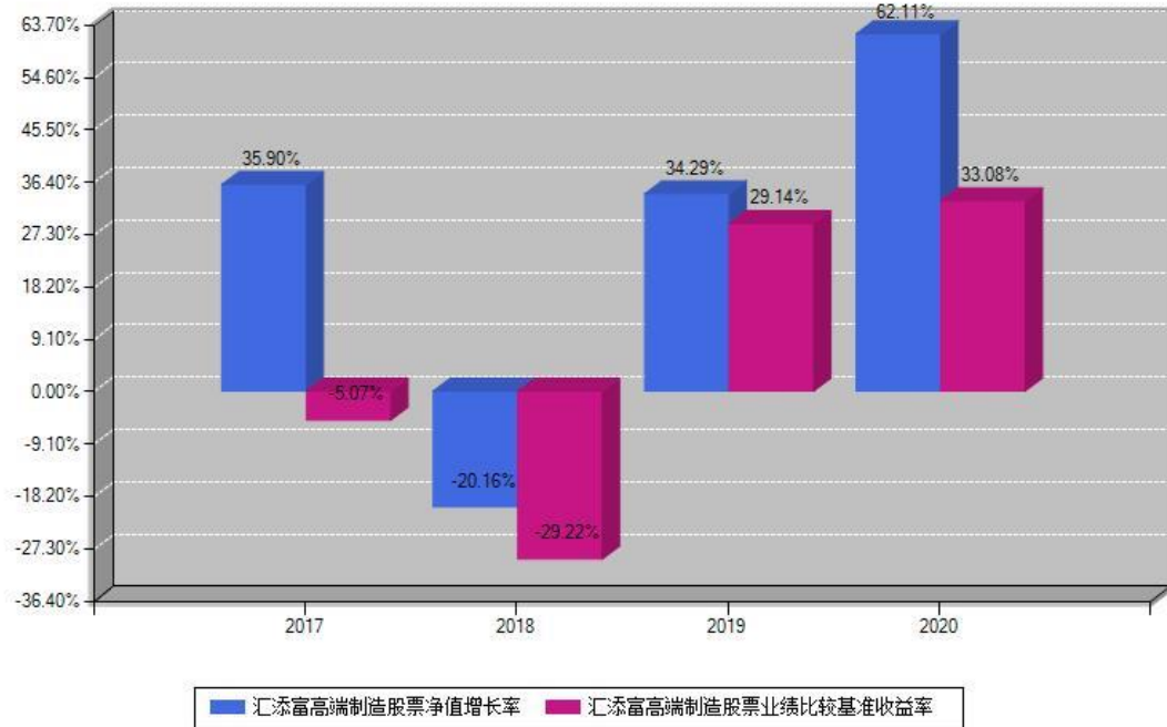
汇添富高端制造股票每年净值增长率与同期业绩基准收益率对比图

注：基金的过往业绩不代表未来表现。本《基金合同》生效之日为2017年03月20日，合同生效当年按实际存续期计算，不按整个自然年度进行折算。