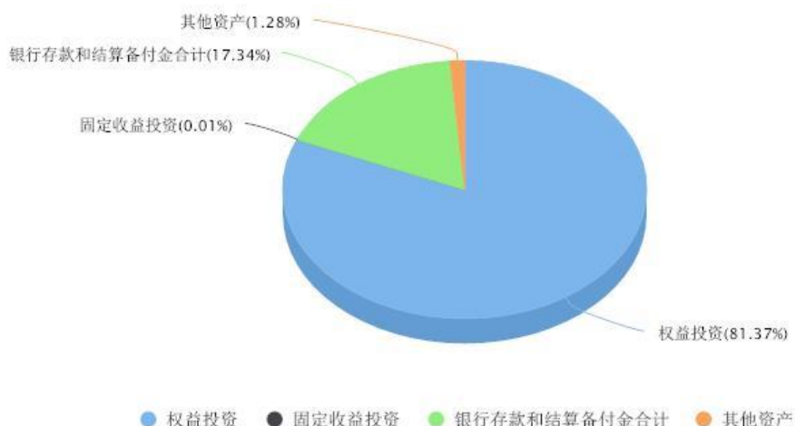
添富全球医疗混合(QDII)美元现钞区域配置图表