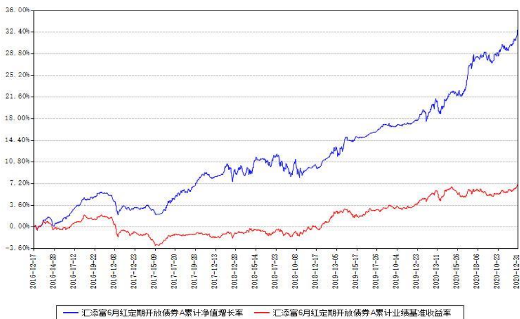
汇添富6月红定期开放债券A累计净值增长率与同期业绩基准收益率对比图