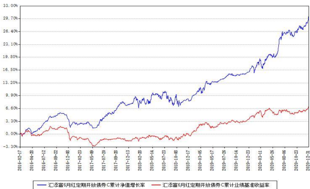
汇添富6月红定期开放债券C累计净值增长率与同期业绩基准收益率对比图