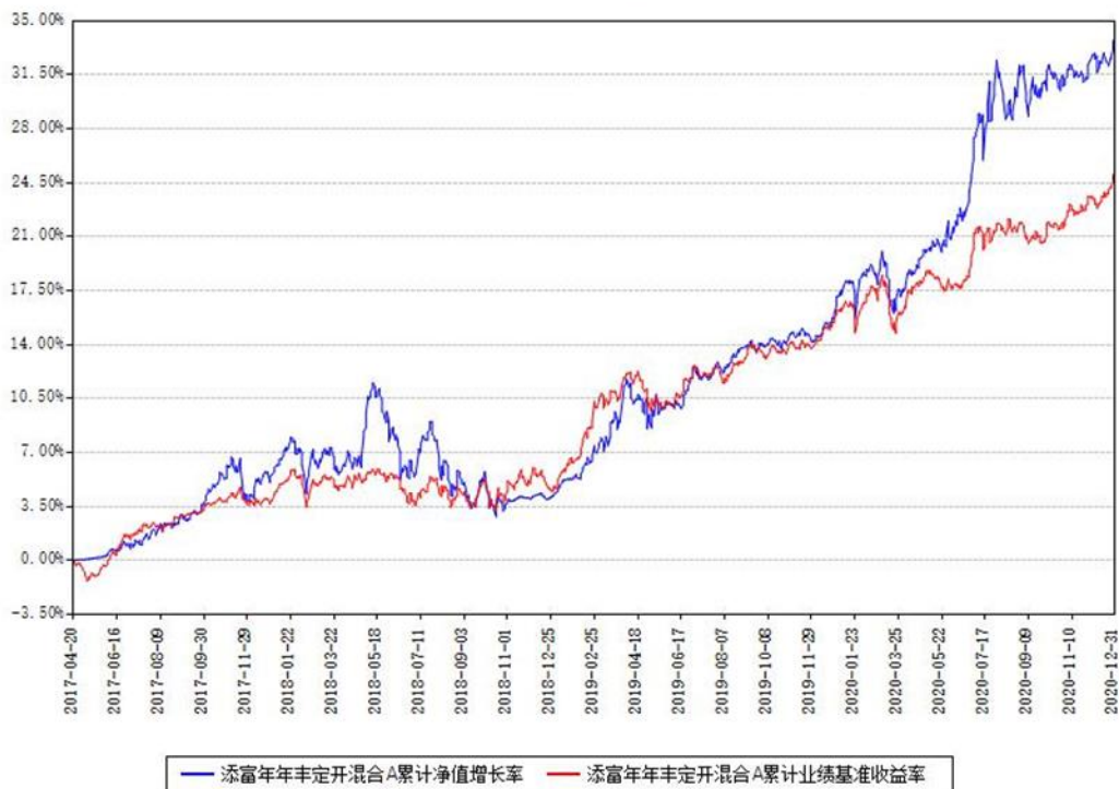
添富年年丰定开混合A累计净值增长率与同期业绩基准收益率对比图