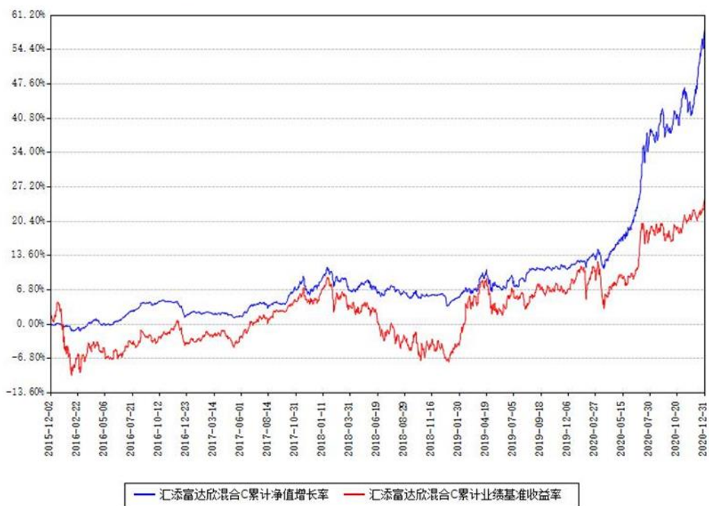
汇添富达欣混合C累计净值增长率与同期业绩基准收益率对比图