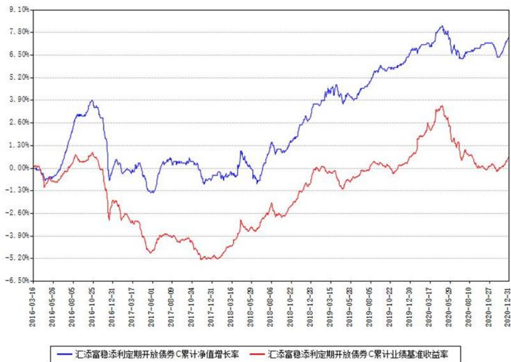
汇添富稳健添利定期开放债券C累计净值增长率与同期业绩基准收益率对比图