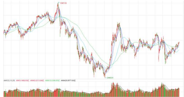
图 1：2017-2020.6 上证综合指数变化趋势图