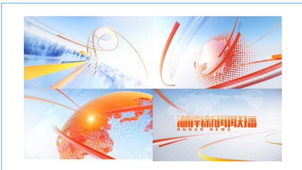
湖南卫视 《湖南新闻联播》片头