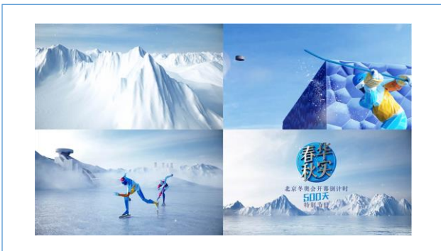
北京冬奥会开幕倒计时 500 天 特别节目