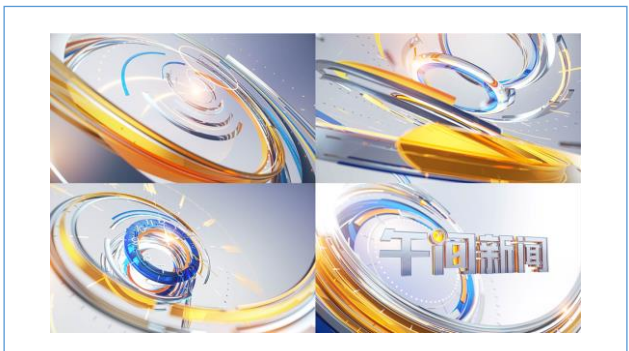
湖南卫视 《午间新闻》片头