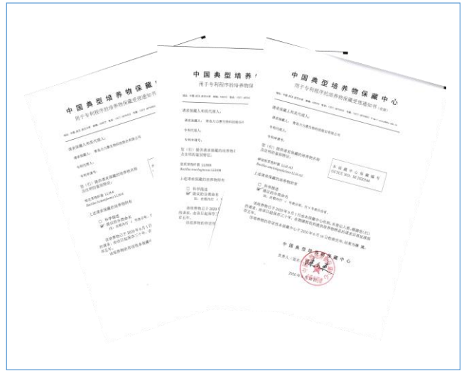
2020 年, 公司自主筛选、保藏专利菌种三个, 公司全力推进微生物肥料研发工作。