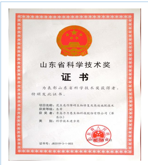
公司参与“花生连作障碍生物修复及高效施肥技术”获得山东省科学技术进步奖。