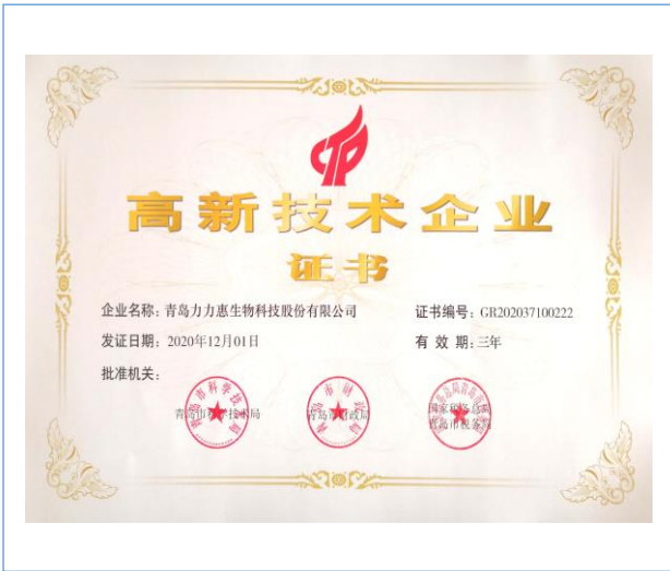
2020 年, 公司通过高新技术企业认定。