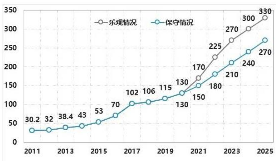
图 13 2011-2025 年全球光伏新增装机预测（单位：GW）