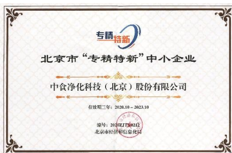
荣获北京市“专精特新”中小企业证书