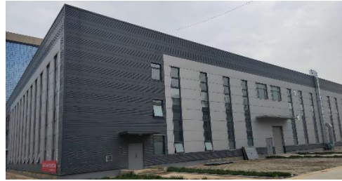
核心工厂 4 月 16 日正式投产