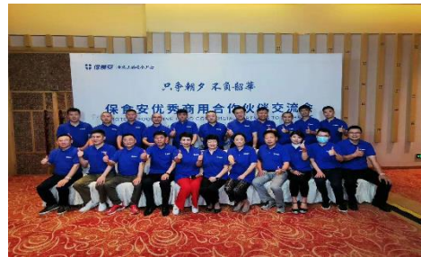
优秀商用合作伙伴交流会 6 月 14 日成功举办