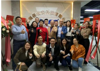
深圳保食安科技有限公司 4 月成立