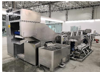
全新一代专业食品净化工业机落地拉萨