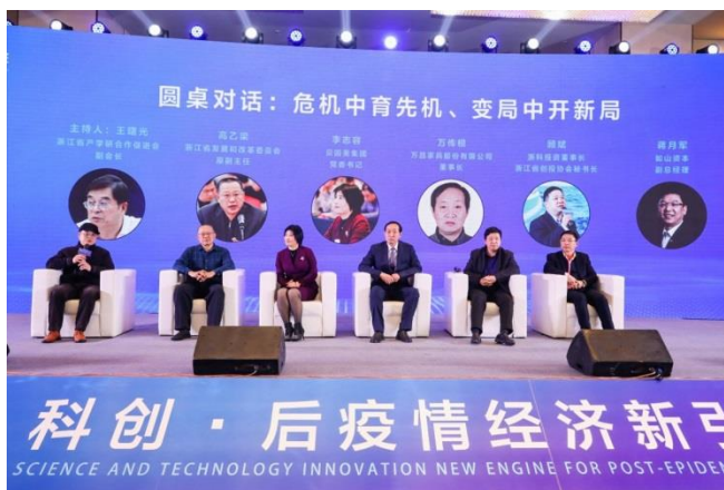
2020.12.27 公司董事长参加贝因美 2020 浙江省产学研合作促进大会