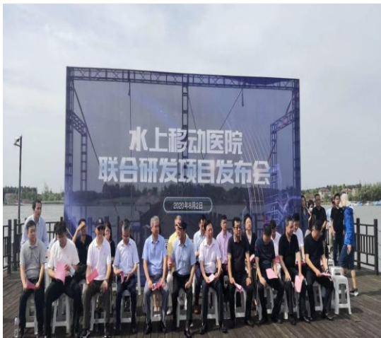
8 月，上海旗华联合同济大学附属东方医院，共同研发“水上移动医院”项目