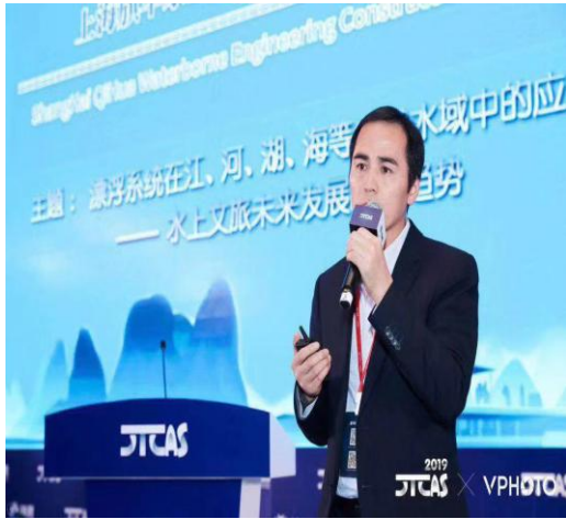
2020 年上海旗华获得了“2019 年度最具投资价值文旅项目”奖