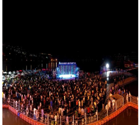
2020 年云南金沙江上夜游演艺项目