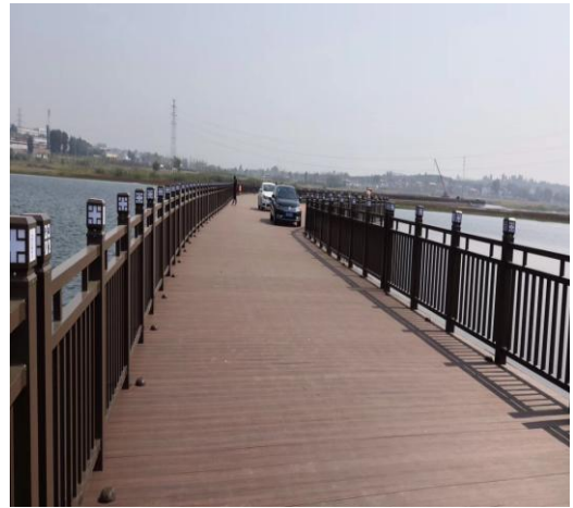
上海旗华在采煤沉陷区打造了一座 1.5 公里大型小汽车通行文化浮桥