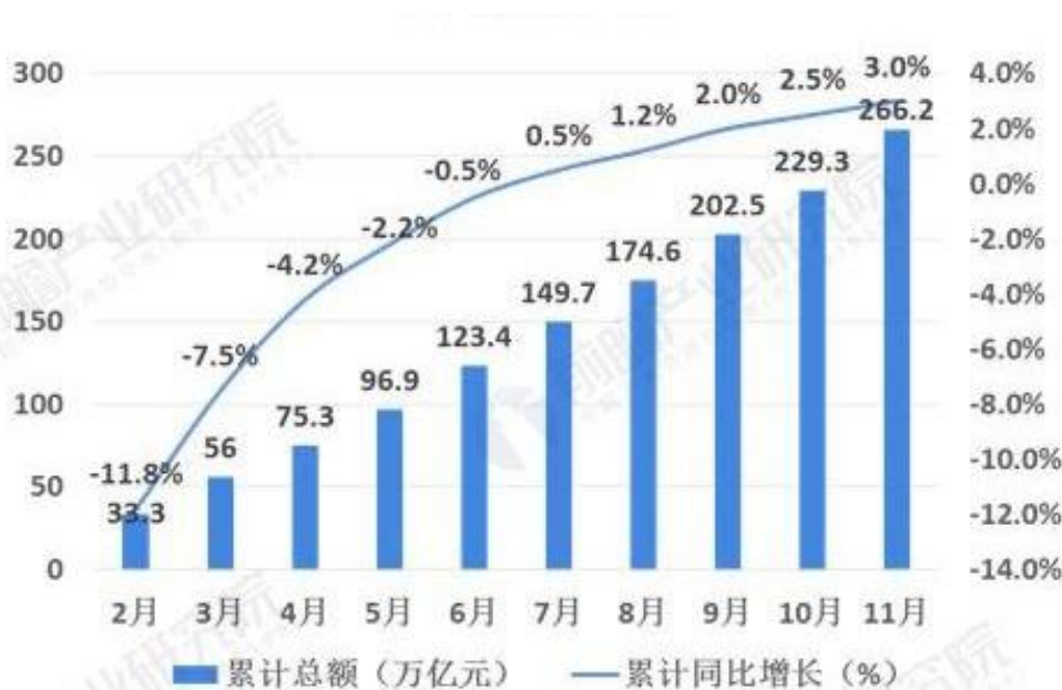
图表 2：2020 年中国社会物流总额累计值及增长变化趋势（单位：万亿元，%）