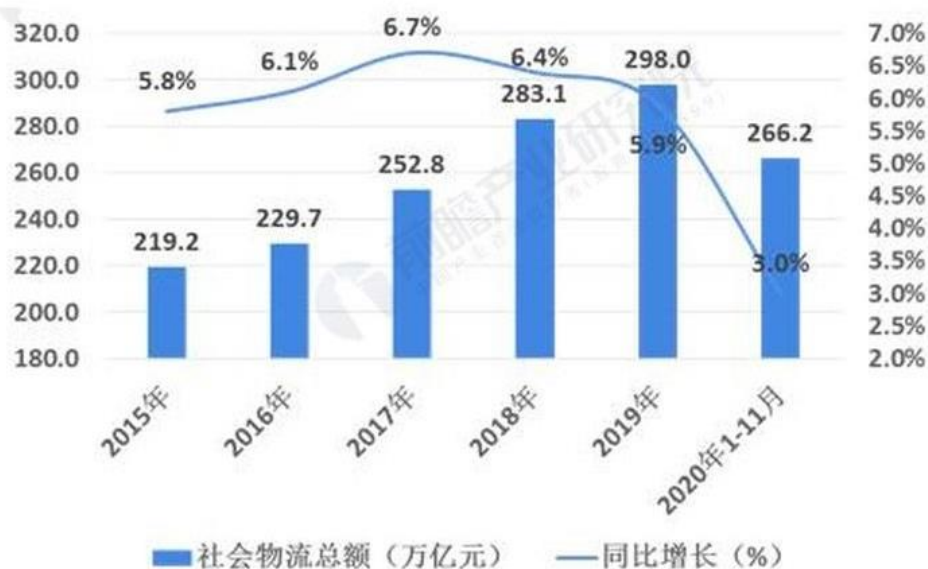
图表 1：2015-2020 年中国社会物流总额及增长情况（单位：万亿元，%）

2020年随着疫情防控和经济发展的统筹推进，我国宏观经济和物流运行逐步恢复常态，本年6月份国内社会物流总额恢复至2019年同期水平。2020年1-11月份中国社会物流总额累计为266.2万亿，同比增长3.0%，物流需求保持回升态势，市场活力进一步增强，业务收入增长加快，整体来看国内物流行业总体稳中向好。