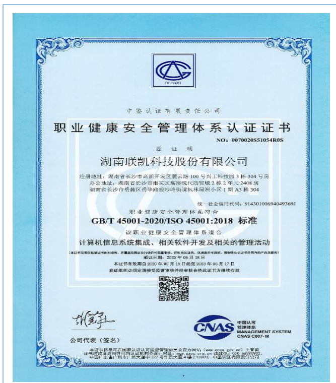
2020 年 6 月 18 日取得职业健康安全管理体系认证证书