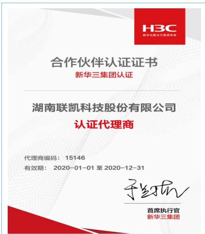
取得 2020 年度 H3C 合作伙伴认证证书