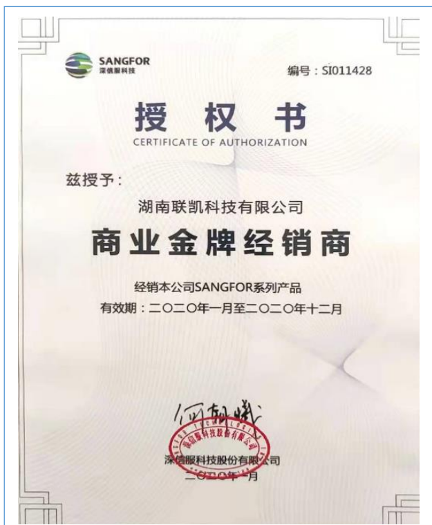
2020 年 1 月取得深信服商业金牌经销商授权书