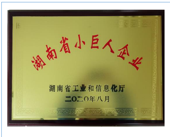
2020年8月公司荣获湖南省小巨人企业