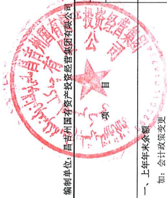
合并所有者权益变动表